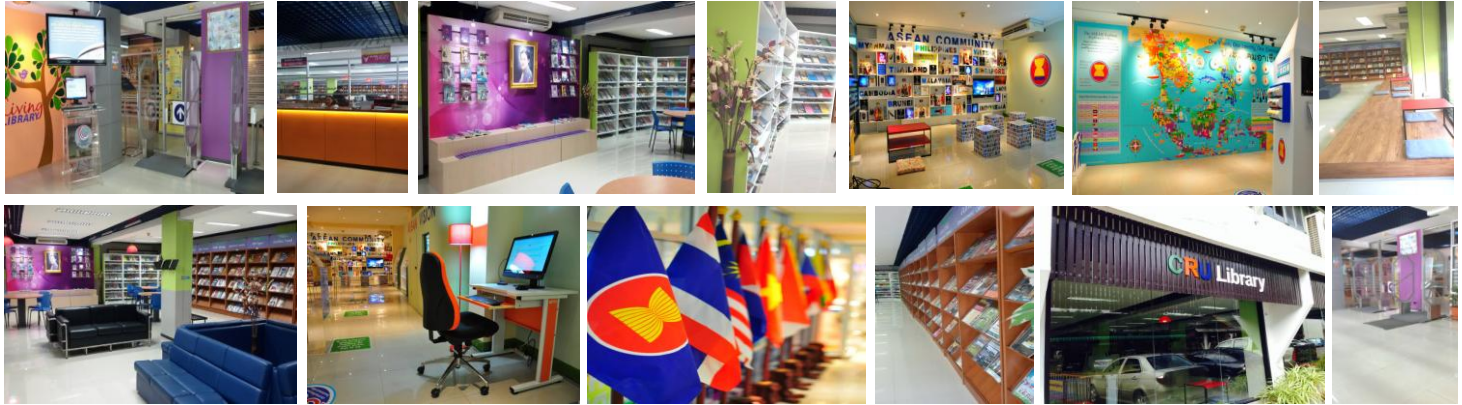
ชั้น 1 ห้องวารสารและหนังสือพิมพ์/มุมหนังสือพระราชนิพนธ์ในสมเด็จพระเทพรัตนราชสุดาฯ/ ห้องอาเซียนศึกษา