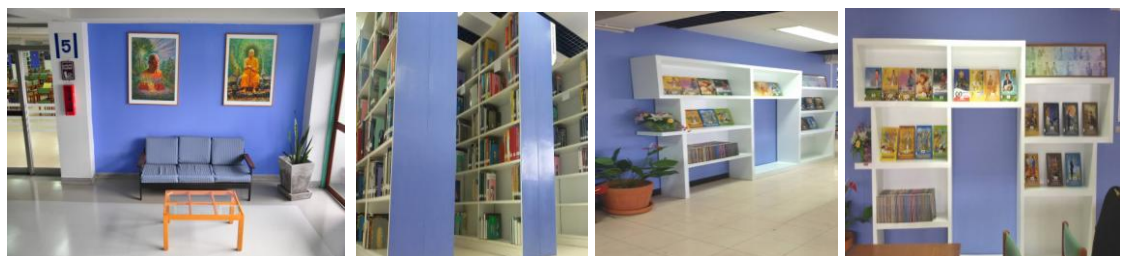
ชั้น 5 ห้องหนังสือทั่วไป ภาษาไทยและภาษาอังกฤษ หนังสือนวนิยาย/มุมพ่อหลวง