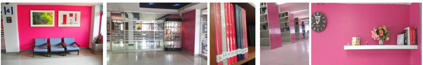
ชั้น 4 ห้องงานวิจัยและวิทยานิพนธ์ /หนังสือทั่วไป