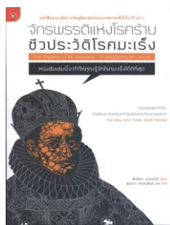
จักรพรรดิแห่งโรคร้าย ชีวิตประวัติโรคมะเร็ง 616.994 ม614จ