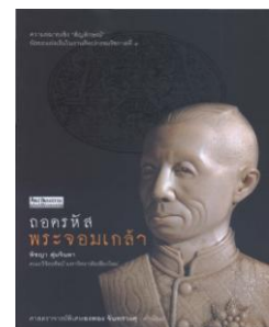
ถอดรหัสพระจอมเกล้า 704.948943 พ639ก