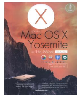
Mac OS X Yosemite & ilife/iwork 005.4465 ส773ค