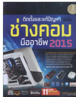
ช่างคอมมืออาชีพ 004.028 ส773ต