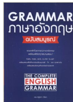
Grammar ภาษาอังกฤษ