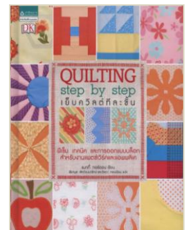
เย็บควิลต์ทีละชิ้น