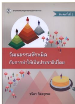
วัฒนธรรมพืระมิดกับการทำให้เป็นประชาธิปไตย