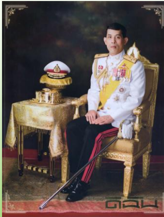
วารสาร ดินัน