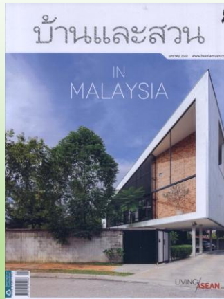
วารสาร บ้านและสวน